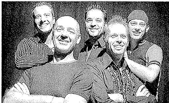
Das Vokal- quintett Montezumas Revenge.

Vokale Akrobatik, Jonglieren mit Akkorden und Verzaubern mit Liedern. Zu ihrer neuen Show «Pop Art» liessen sich Montezumas Revenge von Berlin inspirieren. Die Stadt, die die fünf Holländer durch zahlreiche Gastspiele kennen und lieben lernten. Die Vokalartisten präsentieren eine Varieté-ähnliche Show, mit Elementen aus der Berliner Varieté-Tradition, eingebettet in ein zeitgemässes Repertoire. Ebenso witzige wie ungewöhnliche Arrangements, starke Songs und eigenwillige